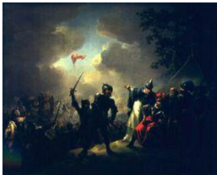
Dannebrog daler ned fra himlen 15. juni 1219 i slaget ved Lyndanisse i Estland (Maleri af C. A. Lorentzen)

Fra 1912 er den 15. juni hvert år blevet fejret som Valdemarsdagen